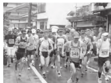
スタートした選手たち