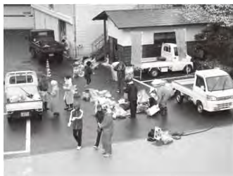
〈四万十川一斉清掃風景〉

4月3日(日)奥四万十博おもてなし一斉清掃(東地区)、四万十川一斉清掃(西地区)が行われました。当日はあいにくの雨でしたが、奥四万十博開幕に向けて、東地区は国道197号線沿いの清掃を、西地区は四万十川周辺の清掃を両地区合わせて約440名の方にご協力いただきました。