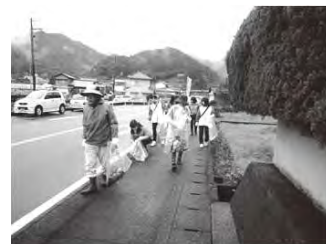
〈奥四万十博おもてなし一斉清掃風景〉

奥四万十博の開幕により、たくさんの方が津野町を訪れることが予想されます。きれいなまちでお客さまをおもてなしするためにも、より一層の環境美化にご協力をよろしくお願いいたします。 (産業課)