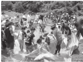
ふなと夏の大作戦！ (船戸地区)

7月30日(土) 船戸地区、8月7日(日) 白石地区で地域主催によるイベントを開催しました。このイベントは高知県清流保全パートナーズ協定事業で高知食糧(株)様からいただいた寄付金により実施したもので、それぞれ町内外から親子連れなど約60人が参加し、河川の清掃活動などを行い、川に親しみながら清流保全に対する理解を深めました。清掃の後には、アメゴ