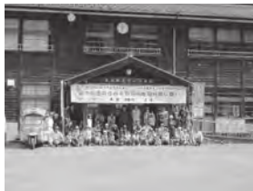
第3回蛍や川魚の住める新荘川を取り戻し隊！ (白石地区)