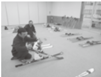
こりゃ上等なもんばっかりくれちゅうね～