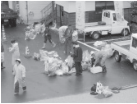
前回清掃のようす