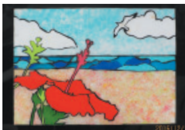
葉山中2年 高橋 優海