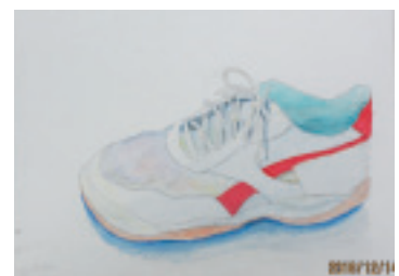
葉山中1年 西海 凧人

津野町の人口 (平成29年2月1日現在) 総人口 6,064人(△6) 男 2,896人(△3) 女 3,168人(△3) 世帯数 2,705世帯(△1) カッコ内は前月対比