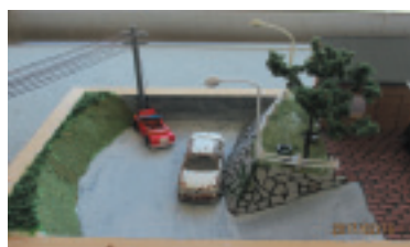
葉山中2年 大坂 武