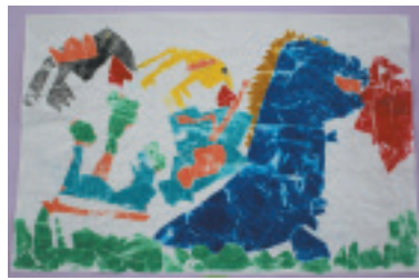
精華小1年 いまはしおうか