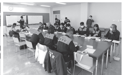
▲災害対策本部訓練(本庁舎)

今回は巨大地震を想定した訓練で、避難所開設においてすべきことや、炊き出し訓練、消火訓練、救出訓練も行い、防災意識を一層深めることができました。