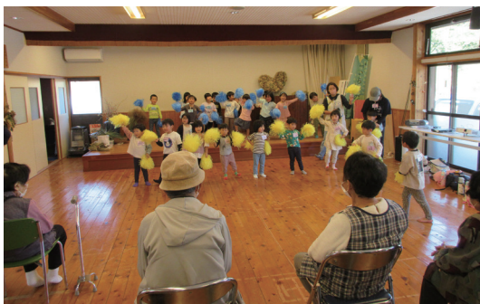
▲ダンスをひろうしたよ

これからも、芋掘りや芋煮会などの活動を通して、地域の方とのつながりを広げていきたいと思えます。