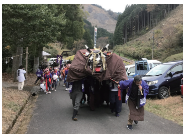
▲高野のおなばれのようす