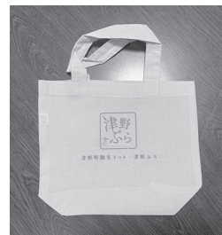
オリジナルミニエコバック