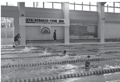
▲訓子府水泳スポーツ少年団記録会