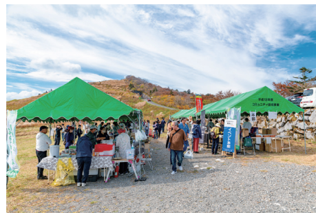
◀にぎわう出店ブース