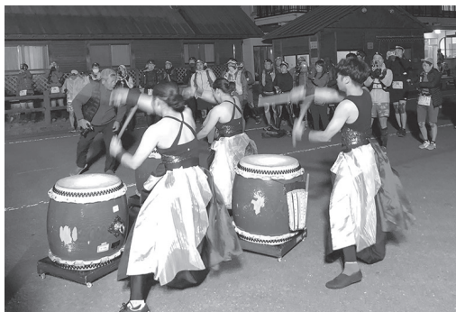
▲一響館侍によるスタート直前の太鼓の演奏

選手は午前4時、満天の星空の中、四国カルスト姫鶴荘前をスタートし、不入山を越えて布施ヶ坂の道の駅へ。ここから鶴松森に登り風の里公園からの眺望を楽しんでから葉山の酒蔵に降り、龍馬脱藩の道を逆走。朽木峠を経て須崎市の吾桑小学校がゴールの超過酷なコース70kmを55名が完走しました。