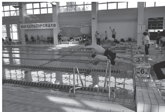
▲KAPPAマスターズ水泳大会

第29回KAPPA(カッパ)マスターズ水泳大会が、11月5日に町温水プール「KAPPA」で開かれました。新型コロナウイルス感染症の影響で、令和元年の開催以来、4年ぶりの開催となりました。訓子府町内をはじめ、近隣の北見市、遠くは滝川市など全道各地から98人が参加しました。競技は、男女別、年齢別の個人種目のほか、男女別や混合の自由形リレーなどの団体種目で行われ、参加者は水しぶきを上げながら力強く泳ぎ、自己記録に挑戦しました。 前日4日には同温水プールにて、第9回訓子府水泳スポーツ少年団記録会が開かれ、小学生34人が参加し、男女別、年齢別の個人種目で自己記録に挑戦しました。 両日とも、プールサイドでは競技仲間や家族が参加者に、大きな声援を送っていました。