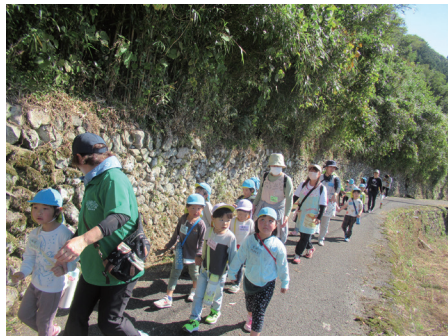
▲あげ道をお散歩中