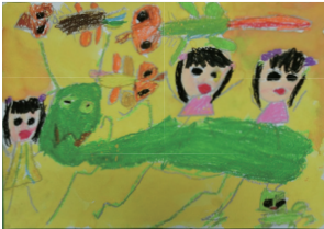
精華小1年 下元 笑々 ふふ