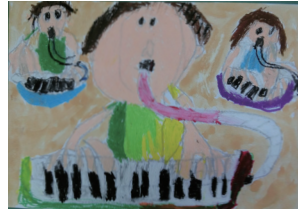
精華小1年 森野 郁 いく