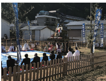
▲姫野々のおなばれのようす