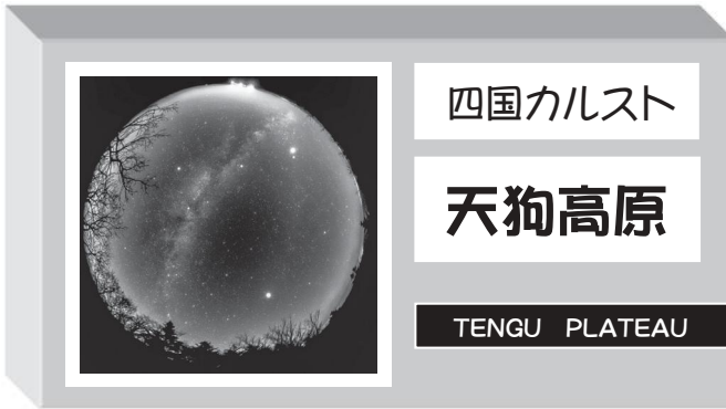
PR用看板のイメージ