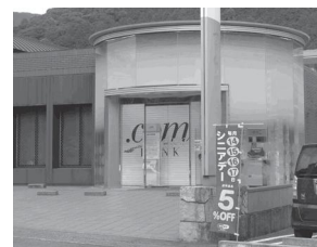
高知信用金庫葉山支店跡

「ふるさとの未来貢献パートナー協定」 を高知信用金庫と締結 地域社会の持続的発展をめざし相互に業務連携 高知信用金庫旧葉山支店跡施設に子どもの居場所 「つのっこくまちゃんる〜む」を開設