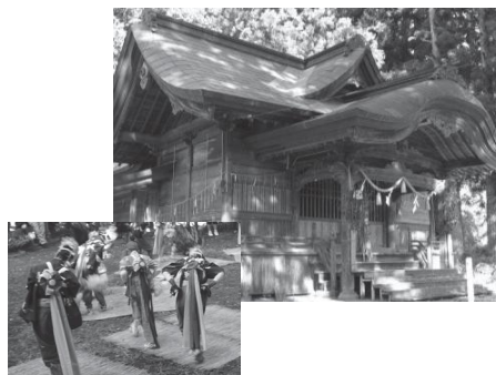
三嶋神社秋の大祭

社会教育主事を配置し、ふるさとを愛し主体的に取り組める人材の発掘と育成に取り組んでいる。