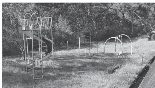
白河瀬公園の遊具

西運動公園(児童公園)の遊具は、令和4年度に一定の改修をしている。本年度も専門業者による安全点検を実施して、指摘箇所については、現在改修計画を立てている。 各学校の運動器具については、学期ごとに教職員が動作確認し、日常的にも目視点検を実施している。認定こども園の遊具は、月1回の職員点検と毎年専門業者による安全点検を実施している。