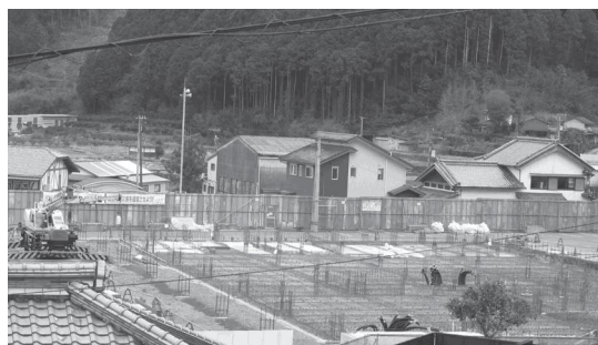
新本庁舎の基礎工事