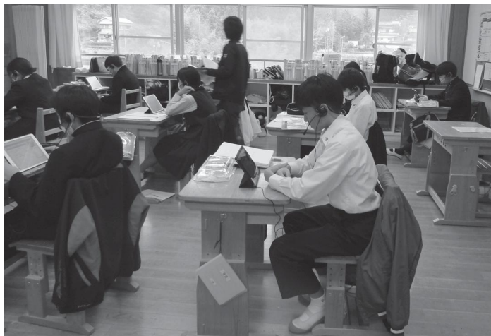
タブレットを使用した学習

石川 小中学生の一人一台のタブレット端末を推奨し、ICT(情報通信技術)教育の充実に巨費を投じて強力に推進している。 持ち帰りなど本町における現状と課題及び今後の方性は。