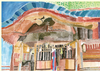
葉山小6年 大崎 史愛夢 りあむ