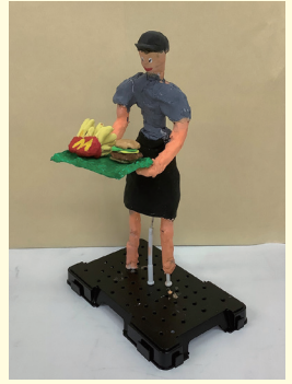
精華小5年 森野 希依 きい