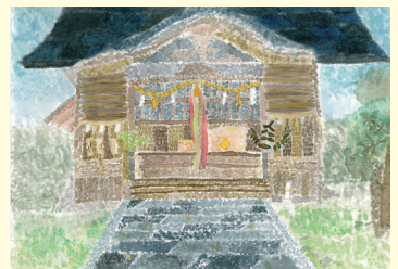
葉山小6年 西内 乃愛 のあ