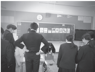
▲ 1億円の重さや量の多さについてレプリカで説明しているようです