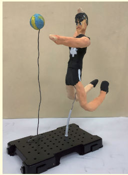
精華小5年 片岡 郁歩 いくほ