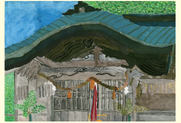
葉山小6年 井上 智優 ちひろ