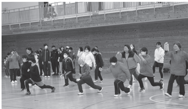
▲ スポーツ教室 Cクラスの様子