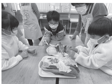
▲4年生350gの野菜を考えているようす

4年生は、朝食の大切さを学ぶ他に「一日にとりたい野菜350g」をクイズ形式で体験してもらいました。