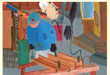
葉山小6年 片岡 純之介 じゅんのすけ

津野町の人口 (令和5年 1月末日現在) 総人口 5,314人(-12) 男 2,515人(-3) 女 2,799人(-9) 世帯数 2,596世帯(-7) カッコ内は前月対比 令和6年3月1日 編集 津野町広報編集委員会 〒785-0201 高知県高岡郡津野町永野471-1 TEL 0889-55-2311 印刷 (有) 笹岡印刷所