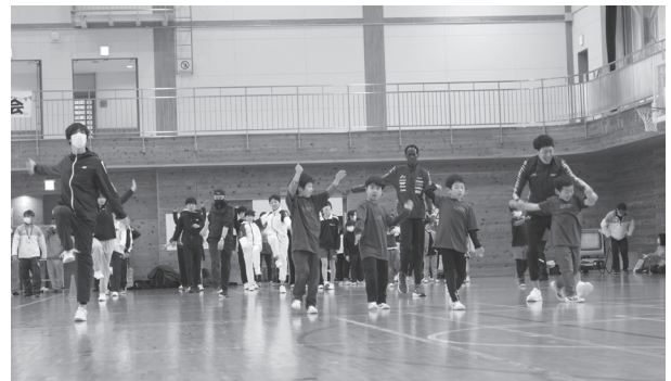
▲ スポーツ教室 A・Bクラスの様子

ポッチャ大会では、家族チームや職場、地域のスポーツクラブなどさまざまなチーム編成があり、全25チームが出場しました。試合では、1球1球ボールがコートに投球されるたびに大きな歓声が上がリ、会場は大盛り上がりでした。