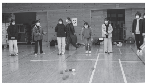
▲ みなさん 真剣にとりくんでいます