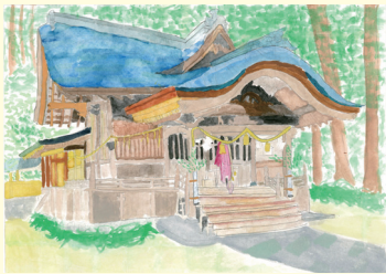
葉山小6年 市川 孟学 たけのり