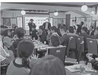
▲抽選会もりあげりました

町を代表してイベントに参加するのは初めての事で緊張していましたが、事前打ち合わせから行程終了まで役場職員の方がリードしてくださり、安心して楽し