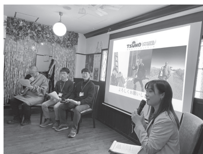
▲トークセッションのようす

く任務を行うことができませんでした。イベント会場内は、高知を懐かしむ人で溢れ、高知一色の雰囲気の流れが流れていました。応援団として町のPRをできたことや、移住を考える参加者の話を生で聞けたことは貴重な経験になりました。今後も応援団活動をしていきますので、皆さんよろしくお願ひします！