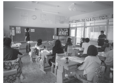
▲ アニメを視聴しているようです

「税金」という少し難しい授業だったかもしれませんが、この授業がみなさんの「税金」について考えるきっかけになればと思います。