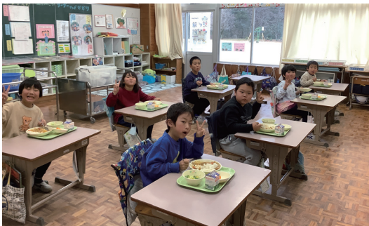
▲ じゃがいも・玉ねぎ おいしいです♪

姉妹まち訓子府町との交流事業の一環として、津野町の学校給食の食材に、訓子府町で収穫されたじゃがいも(馬鈴薯)と玉ねぎを毎年送っていただいています。心より感謝申し上げます。 12月中旬と1月中旬の2回に分けて給食センターに届けていただいたじゃがいもと玉ねぎは、葉山給食センターでは、ポトフや「訓子府町からの贈り物カレー」