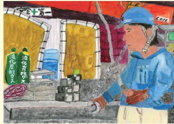
葉山小6年 岡村 萌紗 めいさ