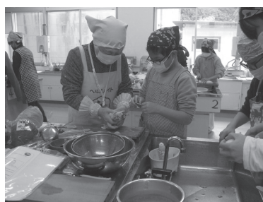
▲5年生調理実習のようす

野菜の重さはけっこう当てる事が難しいです。いつもどのくらい食べているのか、みなさんも一度、実際に量ってみてください。