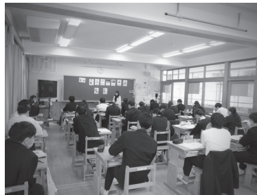
▲ サラリーマン山本君の1日の税金について学んでいるようです