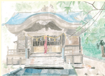
葉山小6年 西森 心優 くう