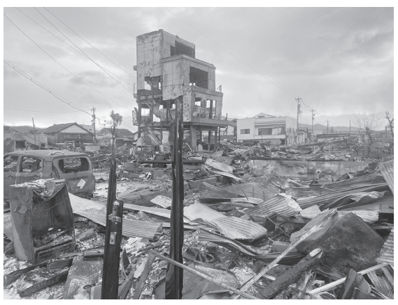
▲大規模火災のあった輪島市朝市付近