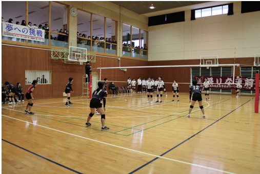
▲小津高校 vs 宇和島南高校

優勝した高知東高校は本大会4試合のうち3試合がフルセットまでもつれ込む接戦を制しての優勝となりました。