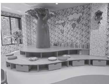
▲つのっこくまちゃんるゝむ