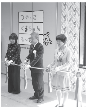
▲完成式典のようす