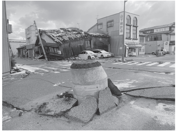
▲液状化で露出したマンホール

消しましたが、未だに続いている地区もあります。本来、水道を使用するためには上下水道の両方の復旧ができていなければなりません。ですが、下水道の復旧はめどすら立っていない状態となっていて、下水道の状態に関わらず水道を使用せざるを得ない状態です。こうした中、急ピッチで仮設住宅の建設が進められていますが、入居希望は4,00