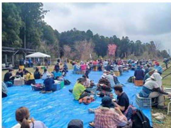
▲昼食会場(脱藩広場)