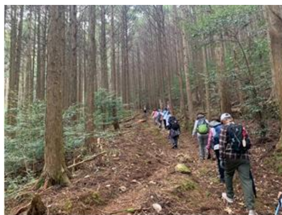
▲険しい山道を進む参加者の皆さん