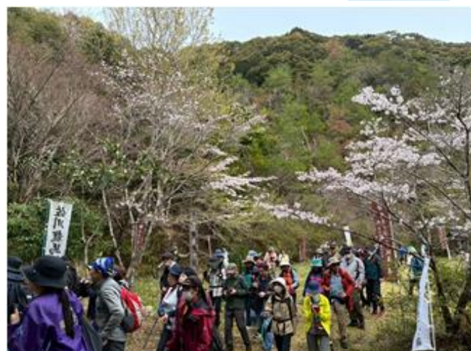
▲佐川龍馬神社からウォーキングをスタート