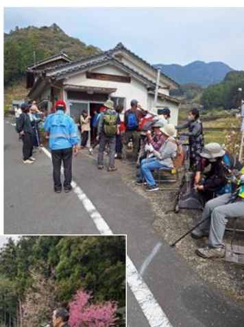
▲道中のおもてなし