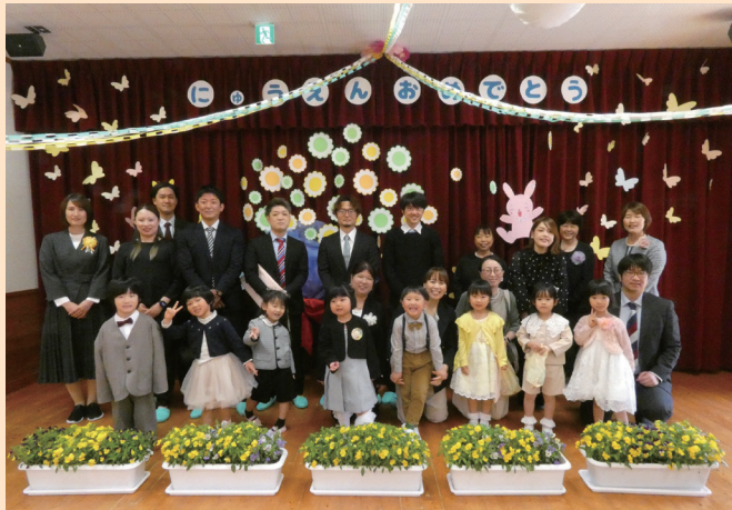
▲さくらんぼ園4・5歳児