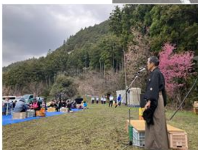
▲龍馬姿の会長ごあいさつ