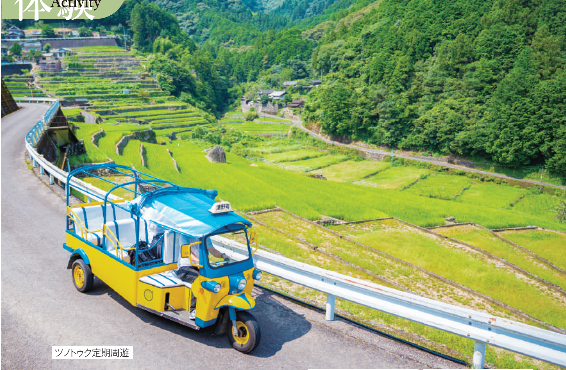
ツノトク定期周遊