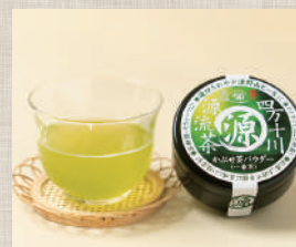
四万十川源流茶 かぶせ茶パウダー