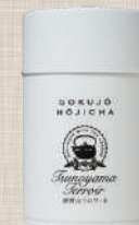
津野山テロワール