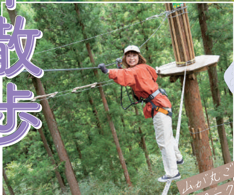
山が丸ごと テーマパーク!