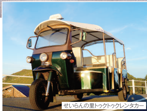
せいらんの里トウトクレンタカー