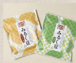
四万十川源流茶 みるく豆