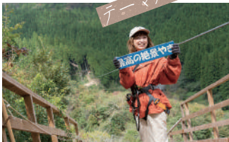
場内には、いろんな文字が書かれた記念撮影用のプレートがあるので自由に写真を撮ってみて。